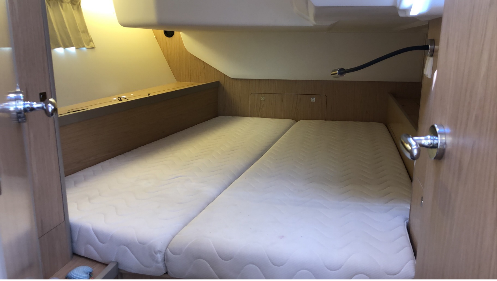
Sancak Kıç Kabin