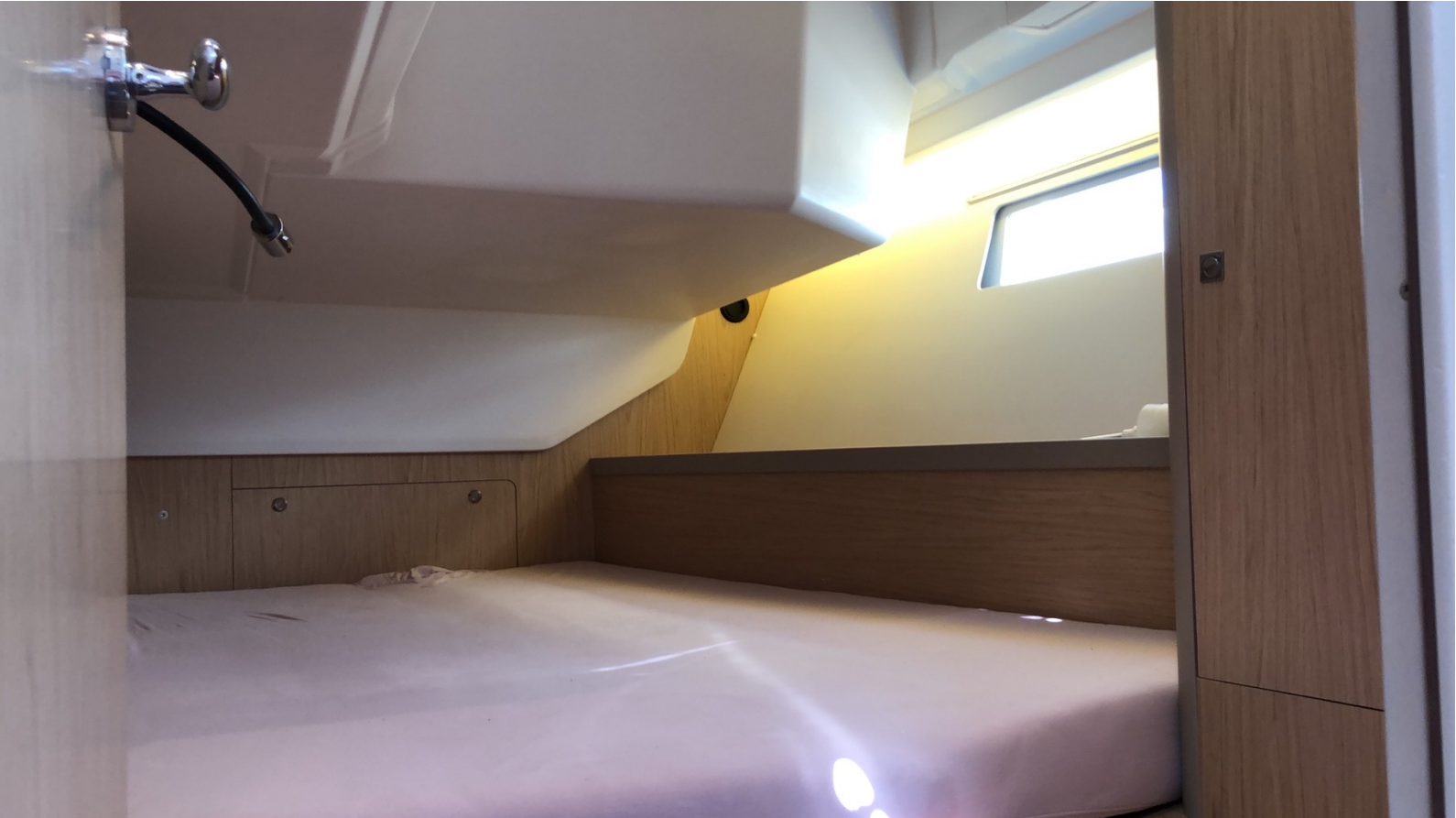
İskele Kıç Kabin